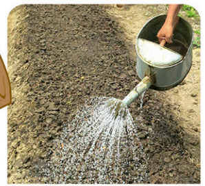
Bisbisi pag maayo