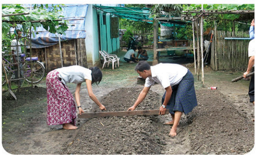
Pataga and pinabukdo nga tamnanan