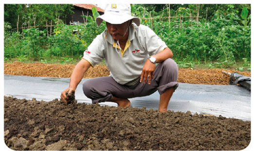
Tangtanga ang dagko nga yuta o pinuha ang yuta

Kung maayo ang pagprepara sa yuta, mapuslan pa ang tabon kutob sa 3 ka sunod-sunod nga tingtanum