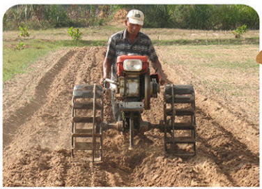
Daroha ang yuta mga 2-3 ka balik ginamit ang traktora o daro gamit ang kabaw