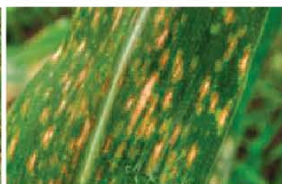
Corn Leaf Blight