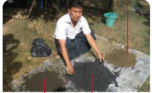
ကောင်းစွာဆွေးမြေ့သော နွားချေး (၁) ဆ