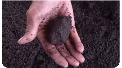
ပျိုးမြေအစိုဓာတ် စစ်ဆေးရန်လက်ဖြင့်ဆုပ်ကိုင်ကြည့်ပါ။