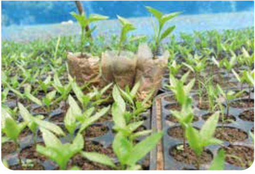
ပျိုးဘန်း (သို့) ပလပ်စတစ်အိတ် အသုံးပြုခြင်း