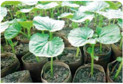
ငှက်ပျောရွက်၊ သရက်ရွက်ကို အသုံးပြုခြင်း