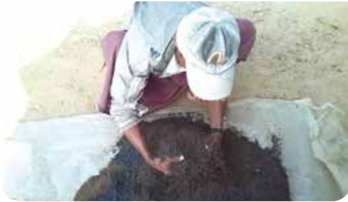
ရောမွှေပြီးနောက် စိုထိုင်းအောင်ပြုလုပ်ပါ။