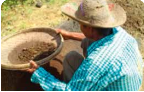
မြေကြီး ဆန်ကာချပါ။