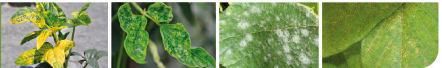
ହଳଦିଆ ମୋଜାଇକ୍ ଭୁଡାଣୁ