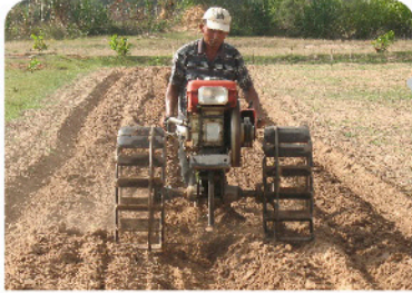
ಟ್ರ್ಯಾಕ್ಟರ್ ಅಥವಾ ಎತ್ತುಗಳ ಸಹಾಯದಿಂದ ಎರಡರಿಂದ ಮೂರು ಸಾರಿ ಆಳವಾಗಿ ನೆಗೆಲು ಹೊಡಿಯಬೇಕು