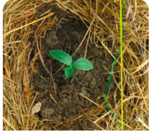
ಸಸಿಗಳಿಗೆ ರಂಧ್ರ ಮಾಡಬೇಕು