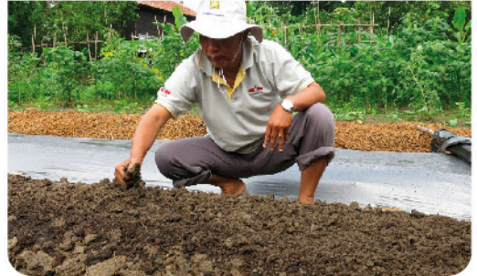
ಮಣ್ಣಿನ ಹೆಂಟೆಗಳನ್ನು ಒಡೆಯಬೇಕು ಏಕೆಂದರೆ ಬಿಸಿ ಗಾಳಿಯನ್ನು ತಡೆಯುತ್ತದೆ

ಬಳ್ಳಿ ತಯಾರಿಸಿದ ಭೂಮಿಯಲ್ಲಿ ಪ್ಲಾಸ್ಟಿಕ್ ಮಲ್ಚ್ ಮೂರೂ ಬೆಳೆಗಳವರೆಗೂ ಇರುತ್ತದೆ