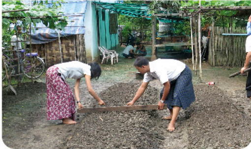
ಮಣ್ಣಿನ ಮಡಿ ಸಮವಾಗಿ ಮಾಡಬೇಕು