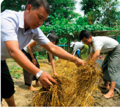
ಚೆನ್ನಾಗಿ ತಯಾರಿಸಿದ ಮತ್ತು ನೀರುಣಿಸಿದ ಮಡಿಗಳ ಮೇಲೆ ೧೦ ಸೆಂ.ಮೀ. ಹುಲ್ಲನ್ನು ಹಾಕಬೇಕು