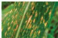
Tizón de la hoja del maíz