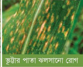
ভুট্টার পাতা ঝলসানো রোগ